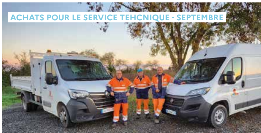
ACHATS POUR LE SERVICE TECHNIQUE - SEPTEMBRE