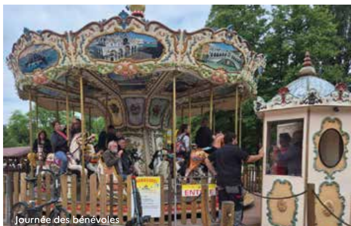
Journée des bénévoles