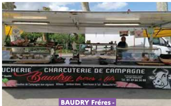
BAUDRY Frères - THOUARS - SAINT JEAN DE SAUVES