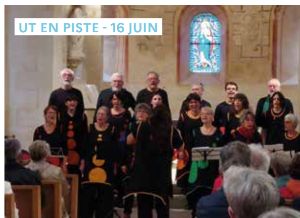
UT EN PISTE - 16 JUIN