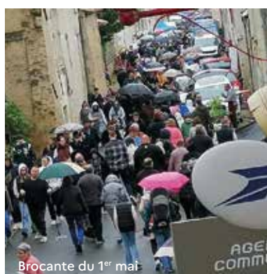
Brocante du 1 er mai