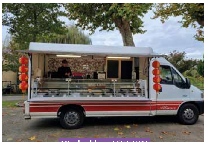
L'Indochine - LOUDUN

Et quand il fera beau, reviendront l'horticulteur et d'autres commerçants.