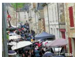
1 er mai