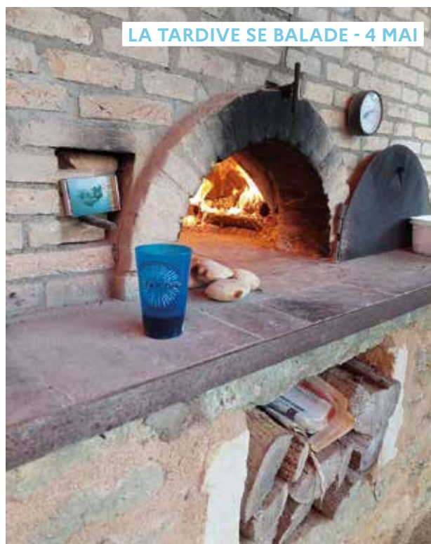
LA TARDIVE SE BALADE - 4 MAI