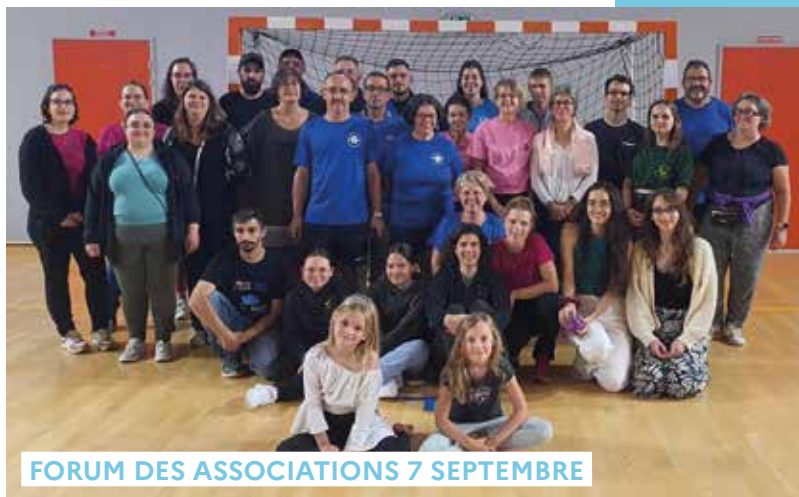
FORUM DES ASSOCIATIONS 7 SEPTEMBRE