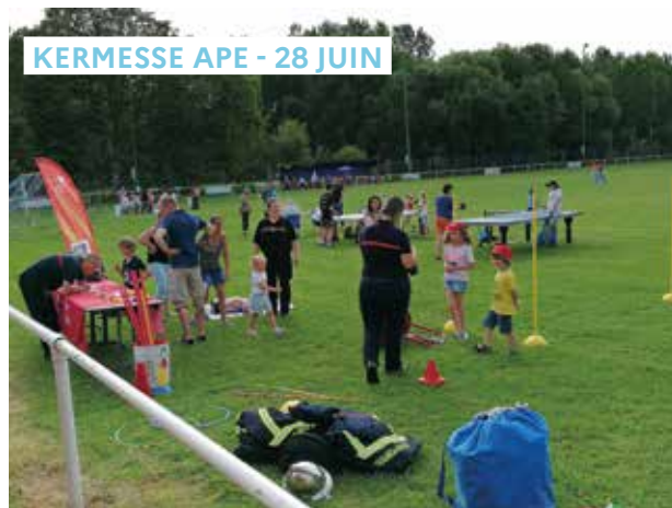
KERMESSE APE - 28 JUIN