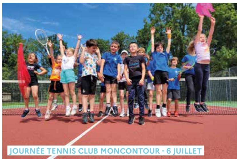
JOURNÉE TENNIS CLUB MONCONTOUR - 6 JUILLET