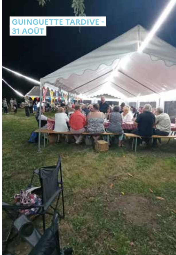
GUINGUETTE TARDIVE - 31 AOÛT