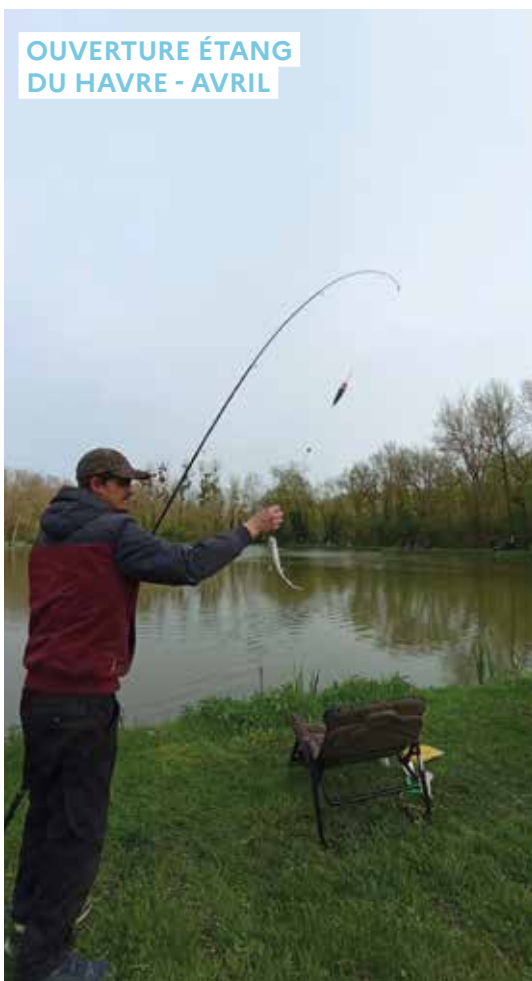
OUVERTURE ÉTANG DU HAVRE - AVRIL