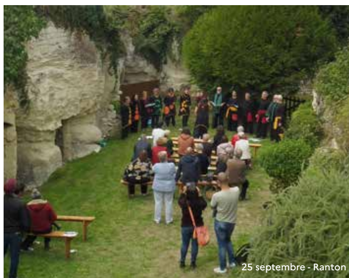
25 septembre - Ranton