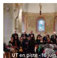
UT en piste - 16 juin