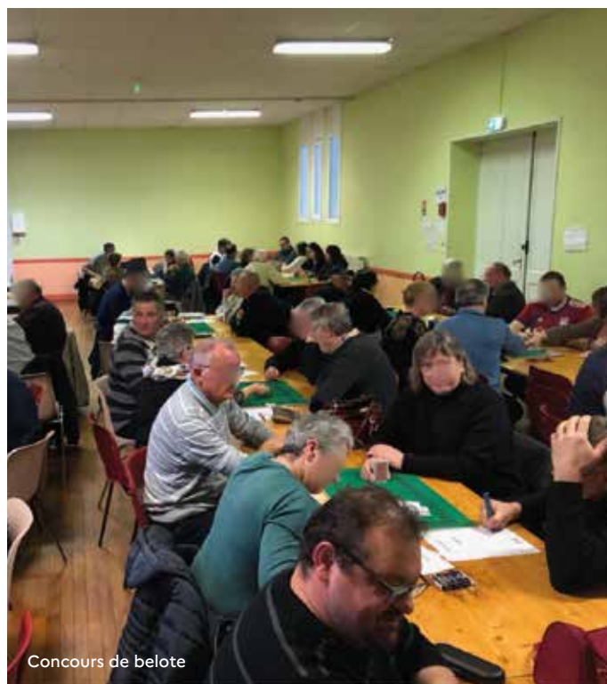
Concours de belote