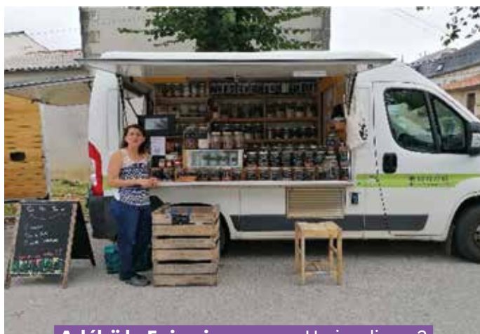
Adélaïde Epicerie en vrac - Un jeudi sur 2