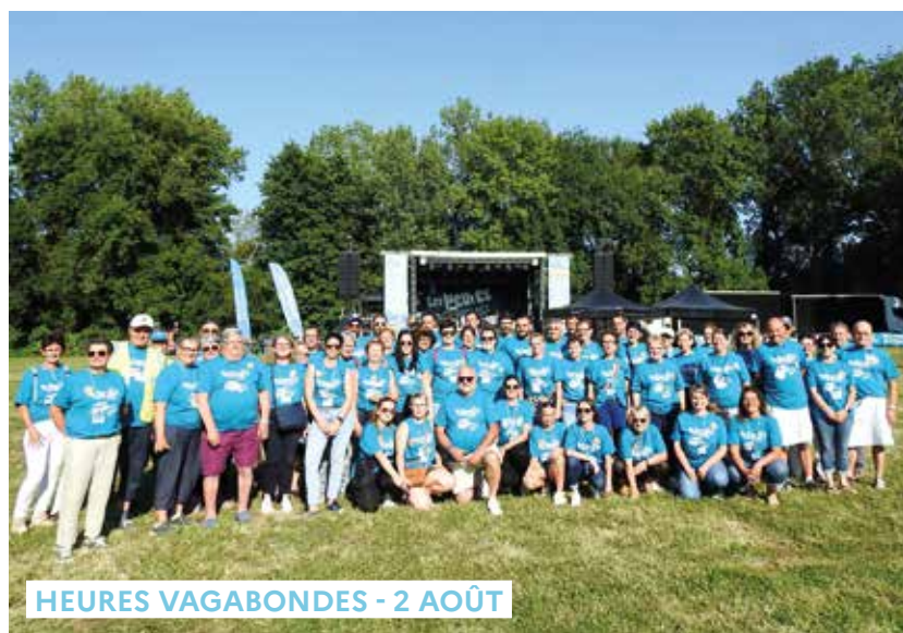
HEURES VAGABONDES - 2 AOÛT