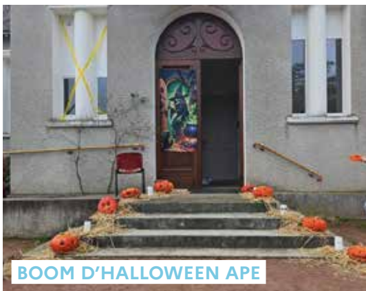
BOOM D'HALLOWEEN APE