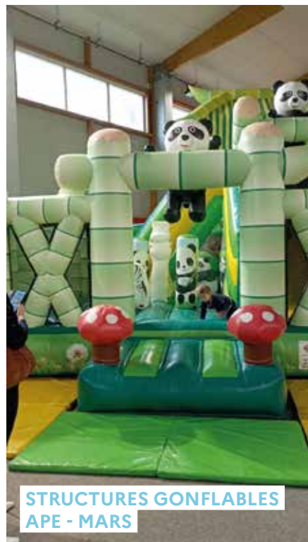
STRUCTURES GONFLABLES APE - MARS