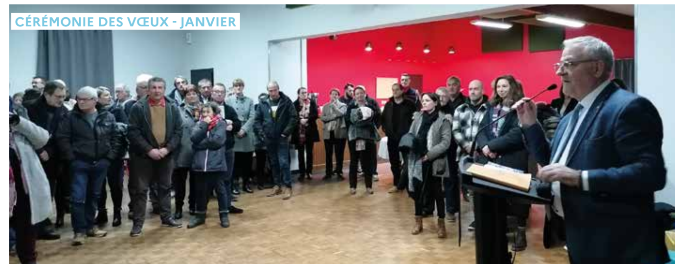
CÉRÉMONIE DES VŒUX - JANVIER