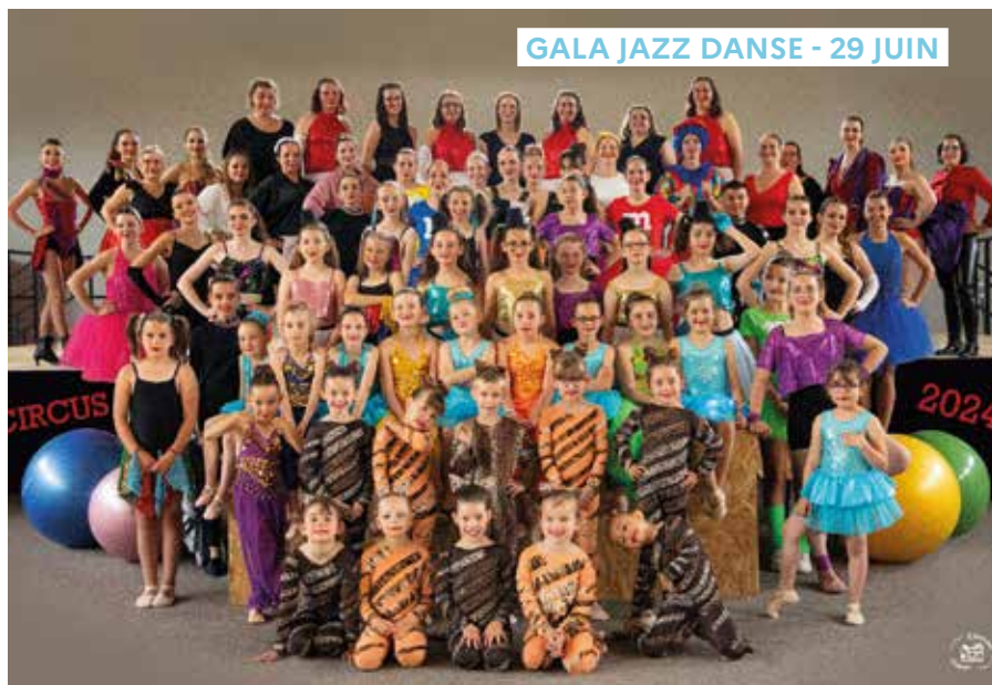
GALA JAZZ DANSE - 29 JUIN