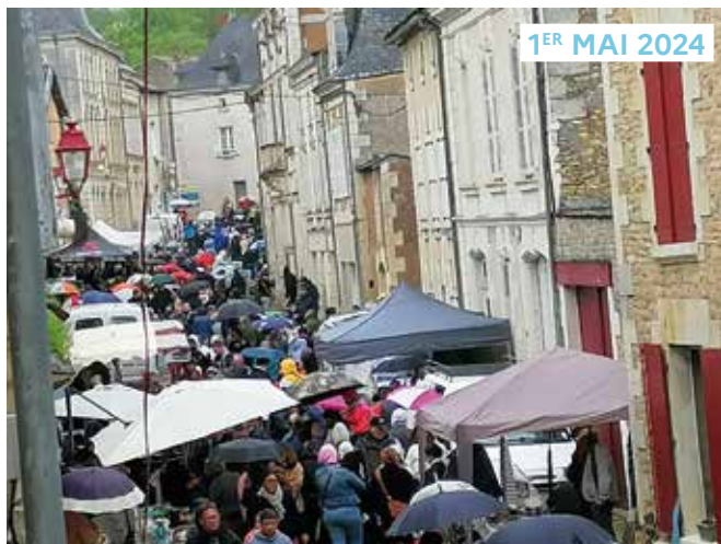
1 ER MAI 2024