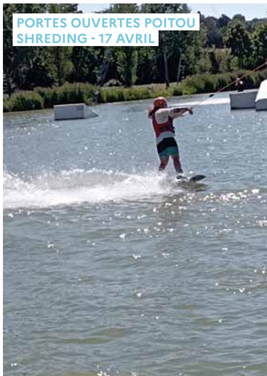
PORTES OUVERTES POITOU SHREDING - 17 AVRIL