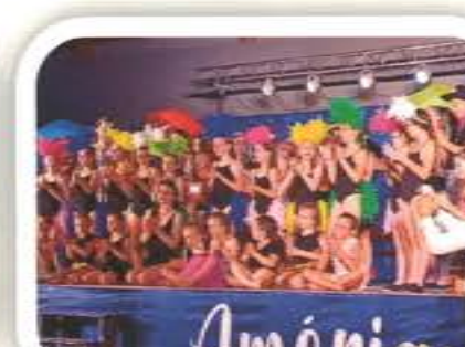
Gala de Danse - Jazz Danse