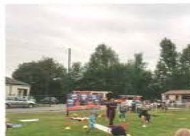
Kermesse – juin 2023