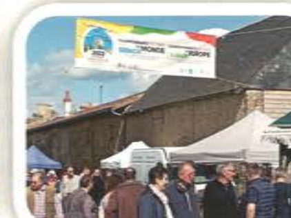
Brocante du 1er Mai