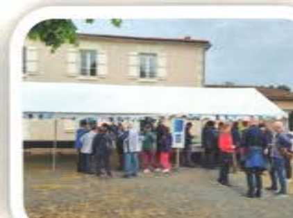
Marche de la Tar'Dive