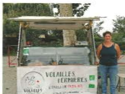
Volailles et fines herbes Plaine et vallée (un jeudi sur 2)