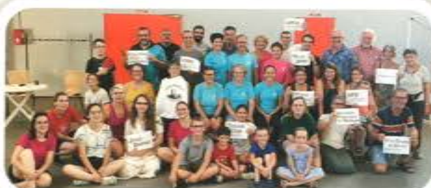
Journée des Associations