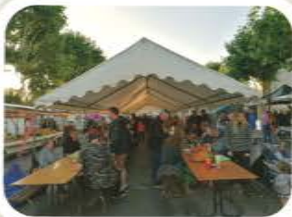
Marché des Producteurs