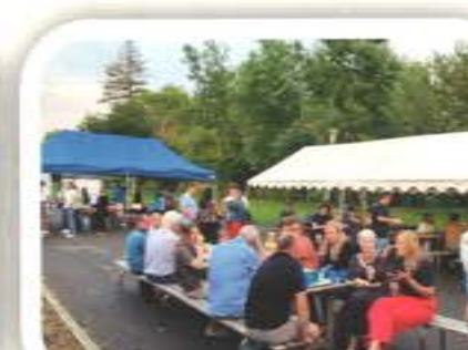
Fête de la Musique la Tar'Dive