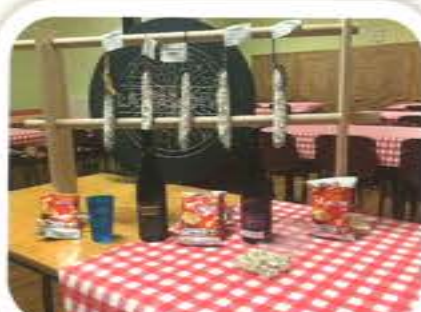
Le Beaujolais de la Tar'Dive