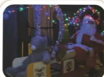
Noël de la Tar'Dive