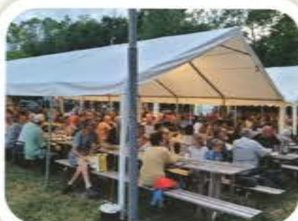
Brocante du 15 Août