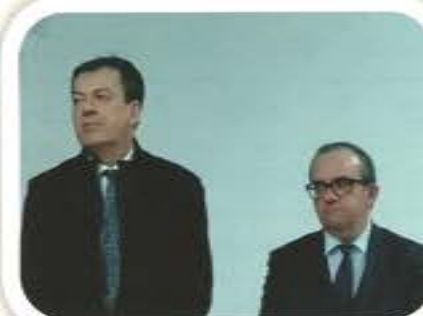
Vœux des Maires