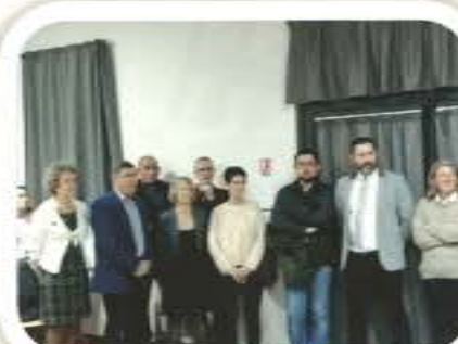
Vœux des Maires