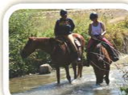
Randonnées des gués