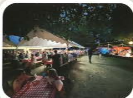
Guinguette la Tar'Dive