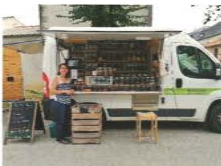
Adélaïde (un jeudi sur 2) Épicerie en vrac