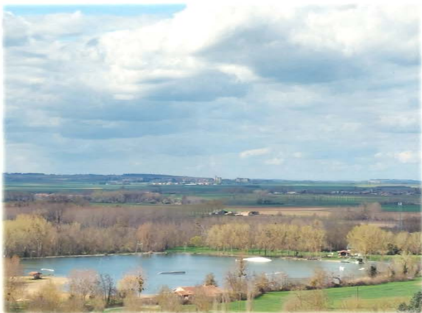
Remplissage du lac le 18 Janvier 2023 pour notre plus grand plaisir