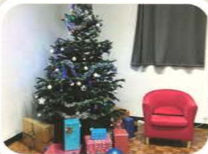
Noël de la Tar'Dive