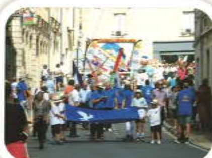
Championnat du Vol Libre