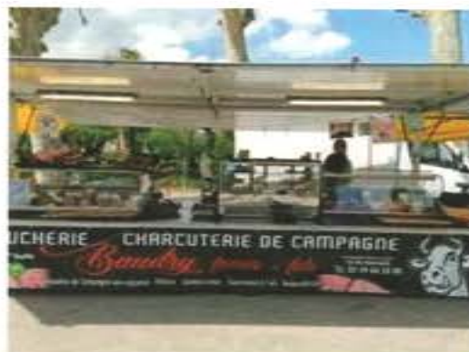
Baudry Frères Thouars