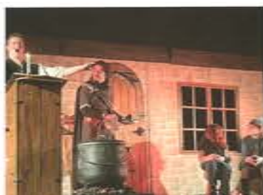
Spectacle magie – février 2023