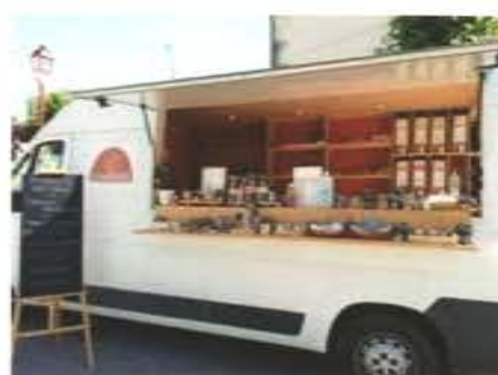
Floriane La nature en balade

Et quand il fera beau, reviendront l'horticulteur et la tricoteuse.