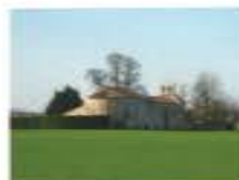
Ouzilly - Vignolles