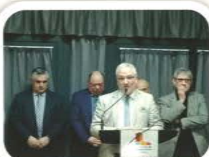
Vœux des Maires