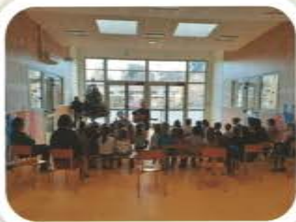
Spectacle Noël de l'APE