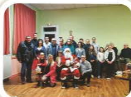
Noël des Pompiers