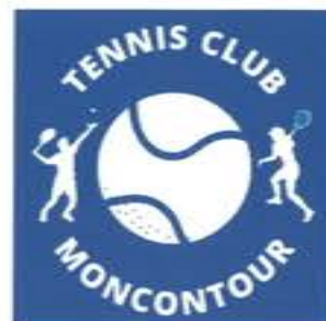
Nouveau logo du club

Nous avons aussi organisé des rencontres inter clubs (Loudun, Thouars et Moncontour) pour les jeunes. Des jeunes (format vert et orange) ont également participé à différentes plateaux organisés par d'autres clubs.