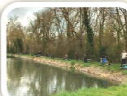
Ouverture Pêche Etang du Havre