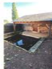
Monts sur Messais